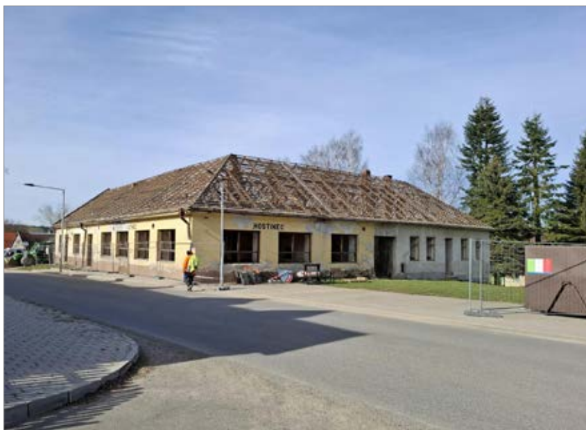
Demolice budovy staré hospody