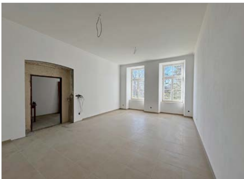
Další opravené interiéry pelecké školy