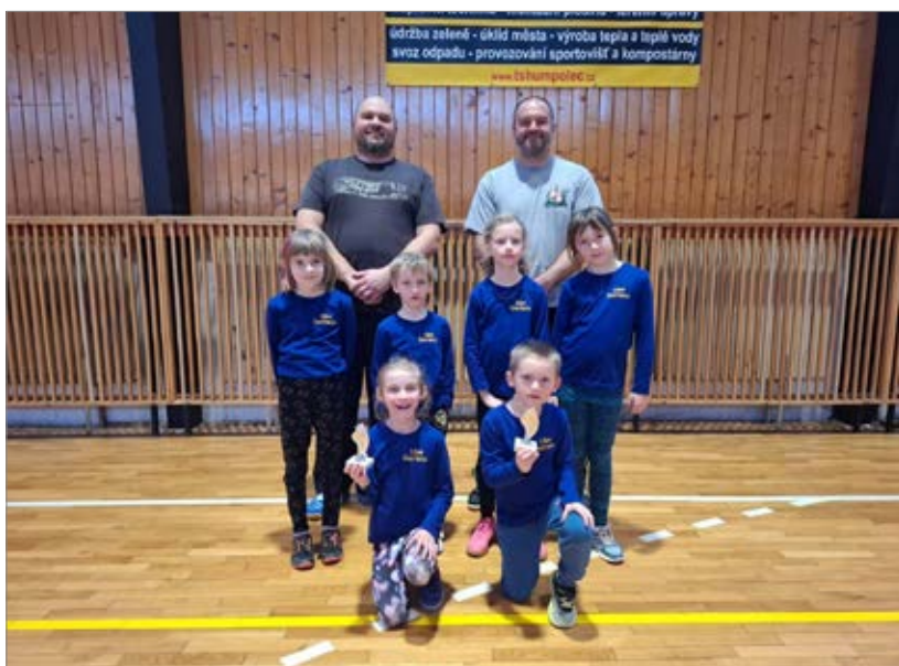
Naše soutěžní družstvo, soutěž Humpolec, foto: Veronika Němcová