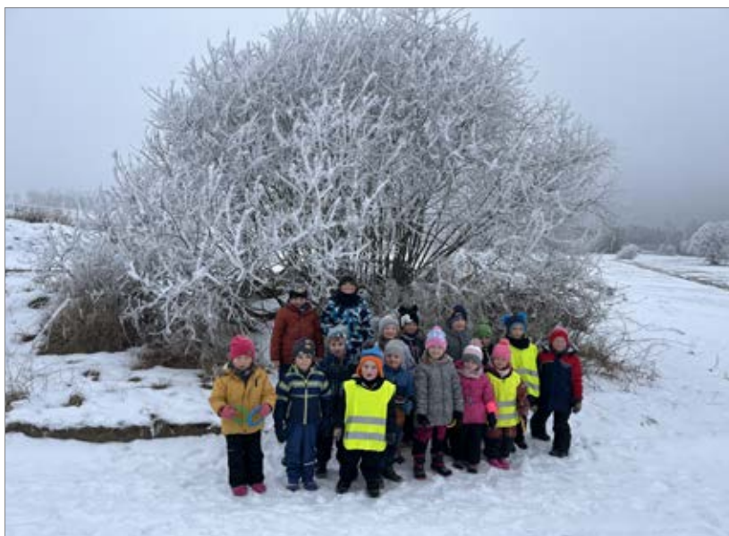
Mrazivá zima