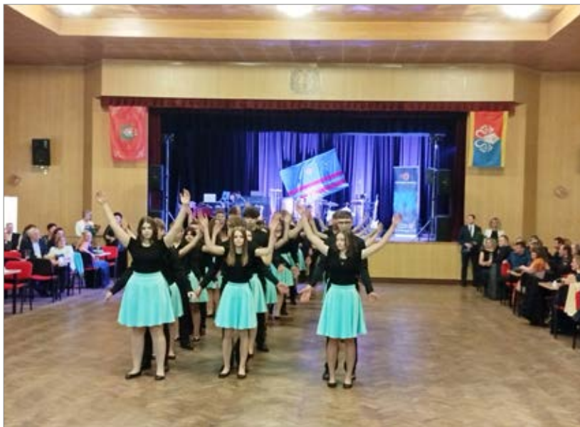
Předtančení ples SDH, foto: Jiří Havlíček

K 1. 1. 2025 má naše členská základna 112 členů, 66 mužů, 36 žen a 10 dětí.