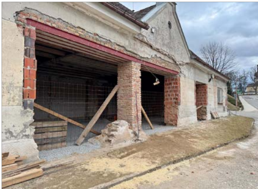
Rekonstrukce budovy starého kulturního domu

Kromě zahajovaných a rozdělaných akcí je již také jedna skoro dokončená. Přes zimu jsme dokončili stavební úpravy interiéru pelecké školy. Opravami prošla druhá polovina budovy, kde byl v minulosti obchod a jedna obytná místnost. Opravené nebytové prostory přístupné samostatným vchodem budou nabídnuty k pronájmu. Věřím, že někomu jako zázemí pro drobnou podnikatelskou činnost poslouží. Možnosti využití jsou samozřejmě širší, budeme o nich dále jednat. Menší obytná místnost bude sloužit jako dětský koutek pro místní maminky s dětmi.