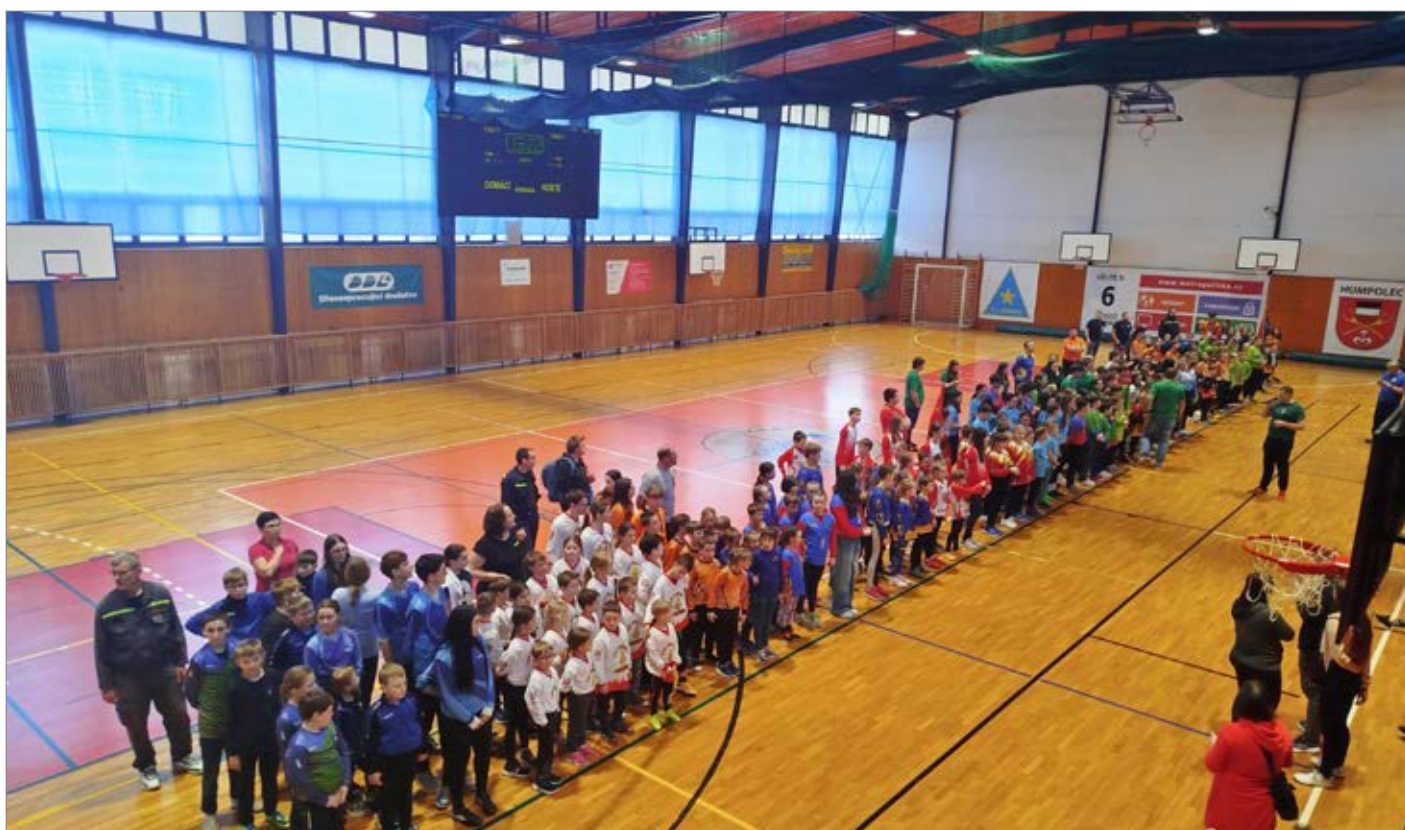
Nástup, soutěž Humpolec, foto: Jiří Havlíček